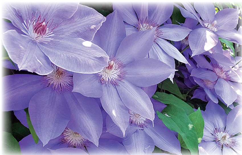
5月の花／クレマチス