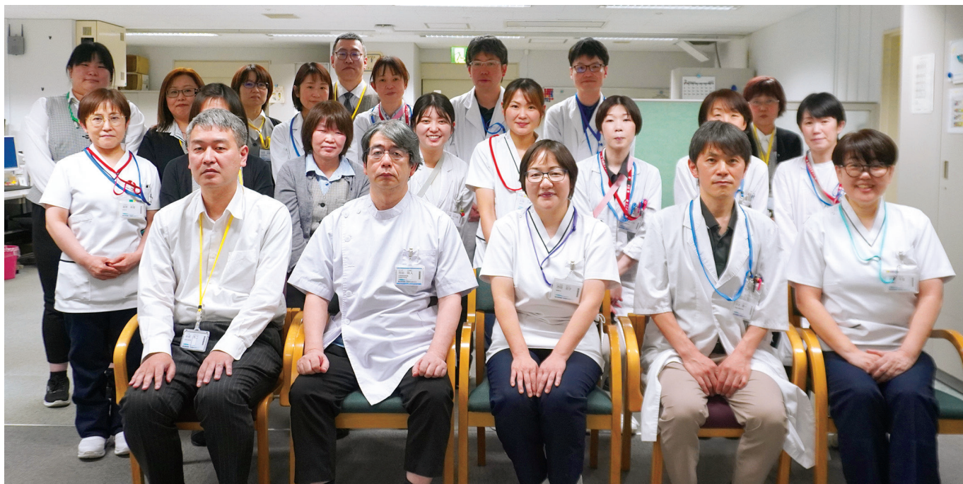
地域連携室のスタッフ

私たちは、地域医療連携部長、地域医療連携室室長、看護師・SW・事務助手の多職種で働いています。ご紹介いただいた患者さんの診療予約など前方連携や転院調整など後方連携をさせていただいております。地域の皆様へ丁寧な情報提供を心がけ、連携を取りながら、患者さんのよりよい生活ができるよう頑張りますので、今後ともよろしくお願い申し上げます。