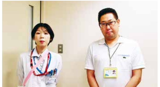
● NPO法人 地域の絆 地域福祉センター鹿川 ●