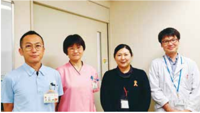
● 医療法人社団 生和会 呉やけやま病院 ●