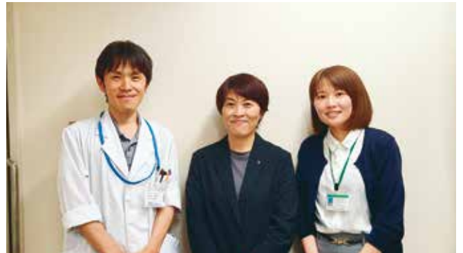
● 社会福祉法人 恩賜財団 済生会呉病院 ●