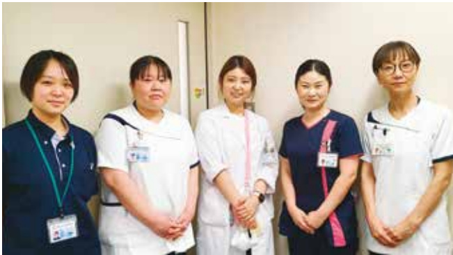
● 社会福祉法人 恩賜財団 済生会広島病院 ●