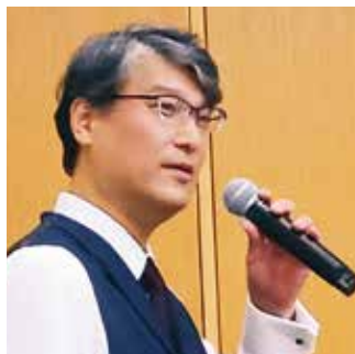
広島大学大学院 医系科学研究科 麻酔蘇生学 教授 堤 保夫先生