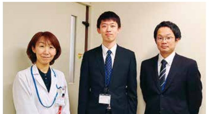
● 医療法人社団 葵会 本永病院 ●