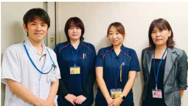
● 地方独立行政法人 広島市立病院機構 広島市立リハビリテーション病院 ●