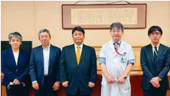
● 医療法人社団 中川会 呉中通病院 ●