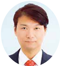
広島大学大学院 医系科学研究科 麻醉蘇生学 教授 堤 保夫先生

広島大学大学院 医系科学研究科 麻醉蘇生学 教授 堤 保夫先生に「医療水準と医学常識」と題されまして、分かりやすくご講演いただきました。講演会の中で先生ご自身の入院経験や登山の際にSPO 2 の変動について実験されたことなどを伺い、楽しく聴講させていただきました。(以下抄録より)