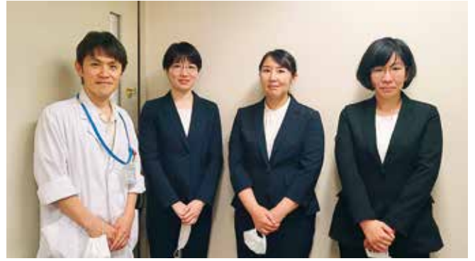
● 医療法人エム・エム会 マッターホルンリハビリテーション病院 ●