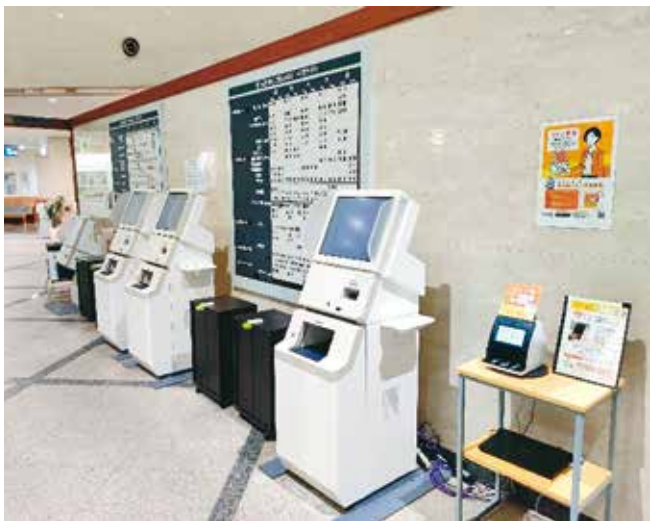
マイナ受付認証機 再来受付機横

当院では再来受付機の横へ認証機の設置やマイナンバー受付専用のレーンを設け、患者さんにご利用いただきやすいよう工夫しているところです。今後は認証機の増設や電子処方箋の導入など、スムーズな電子化への移行に取り組んでいきます。