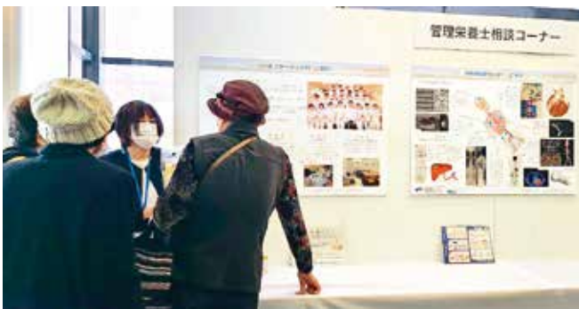
管理栄養士相談コーナー：栄養管理室長 兼任美