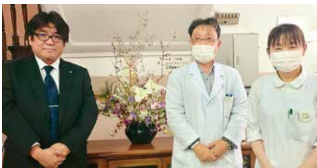
• 呉芸南病院 •