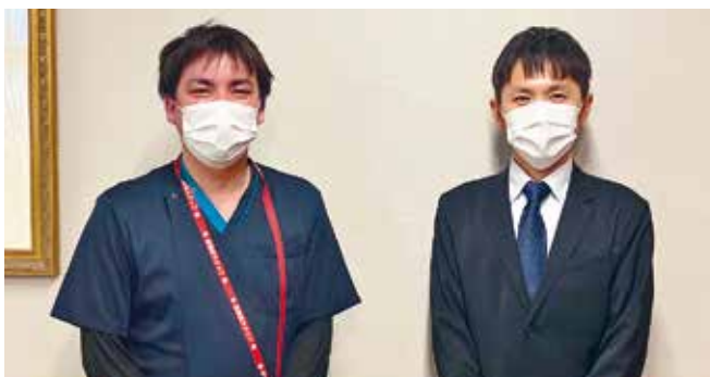
• 広島中央リハビリテーション病院 •