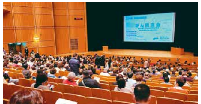
がん講演会会場風景