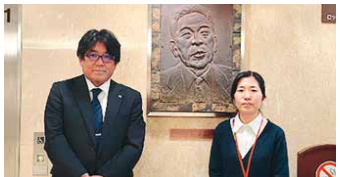
• 呉市医師会病院 •