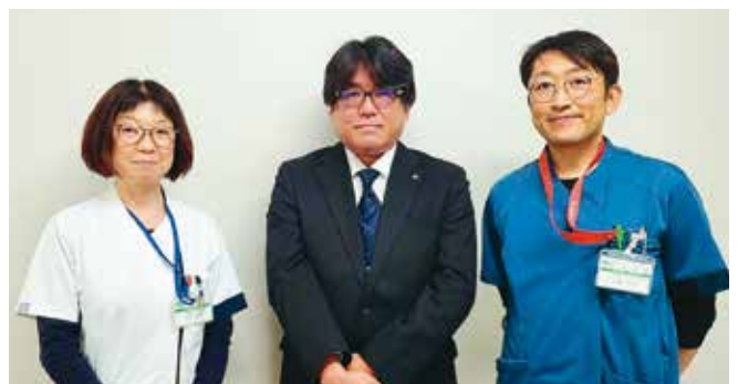
• 医療法人社団 葵会 本永病院 •