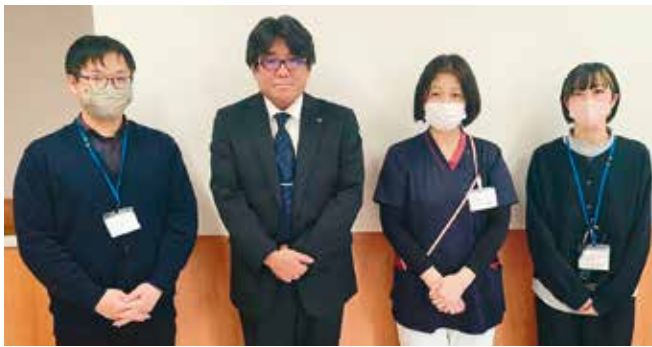
• 医療法人社団 薫風会 横山病院 •