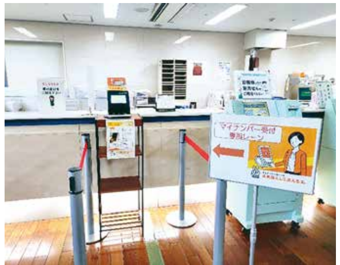
マイナ受付認証機 専用レーン