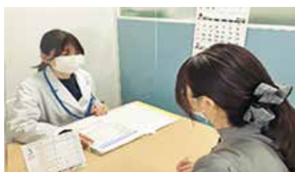
栄養士からの説明