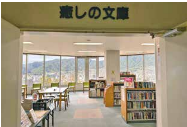
癒しの文庫入口からの風景

更に、この図書室からの眺望の良さも自慢です。入って真正面の大きな窓から望む、標高737メートルの灰ヶ峰、視点を下に向けると呉市街の本通りから呉越え方面の景色が広がります。このパノラマを見るために来所される方もいらっしゃいます。当院で過ごす時間に、少しばかりのほっこりした時間や場所になれば幸いです。みなさんのご来室をお待ちしております。