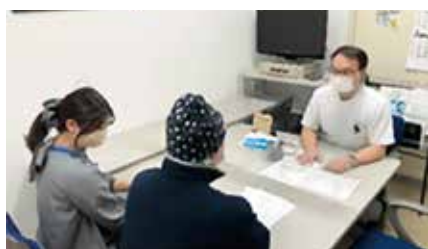
薬剤師からの説明