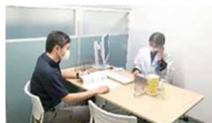
ソーシャルワーカーからの説明