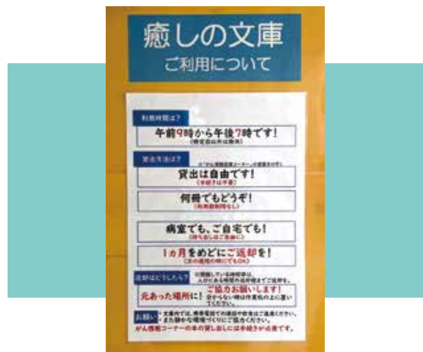
癒しの文庫ルール