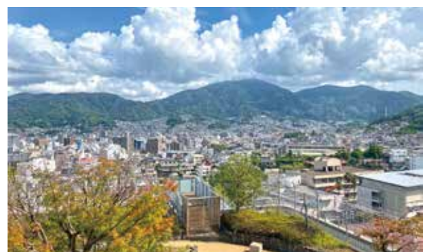
癒しの文庫景色灰ヶ峰と院内庭園