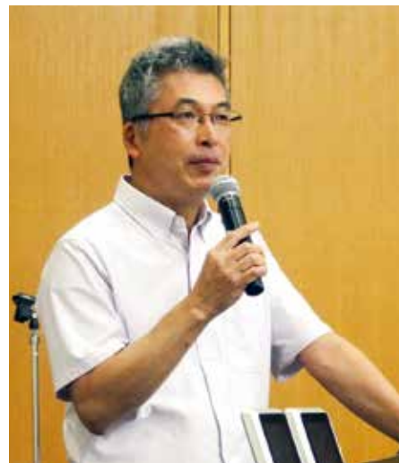
広島大学大学院 医系科学研究科 救急集中治療医学教授 志馬伸朗先生