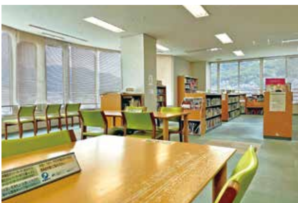
癒しの文庫読書スペース