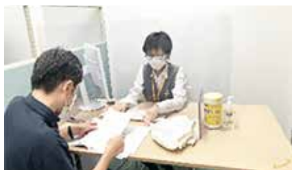
事務員からの説明