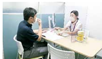
看護師からの説明