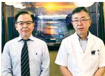
• きむら内科消化器科クリニック •