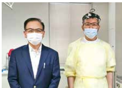
● 渡部耳鼻咽喉科医院 ●