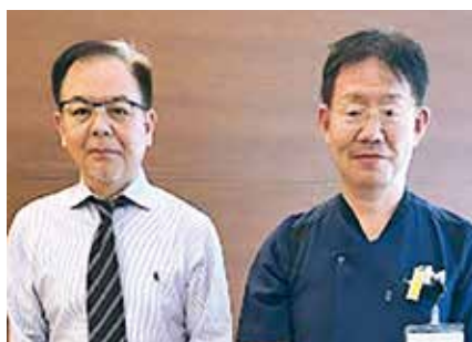
• 中央内科クリニック •