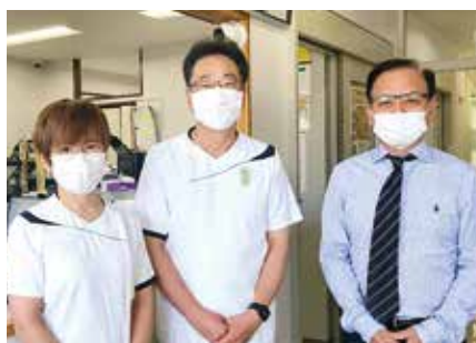
• 大宇根内科呼吸器科クリニック •