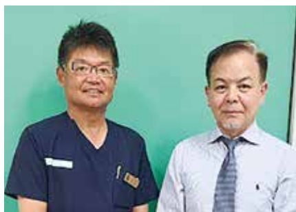
● やすもとクリニック ●