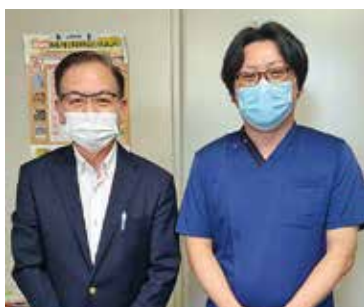
・ よつばクリニック ・