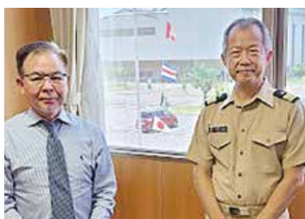
● 自衛隊呉病院 ●