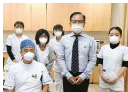
● きむら耳鼻咽喉科クリニック ●