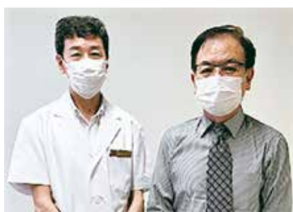
● たまき整形外科 ●