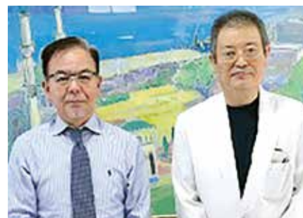
● 医療法人社団 向日葵会 角医院 ●