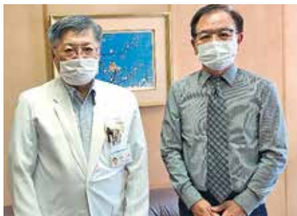
● 医療法人緑風会 ほうゆう病院 ●