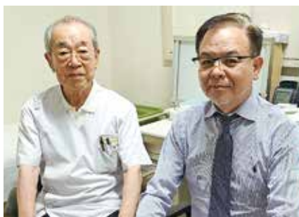
● 医療法人社団はまい会 大君浜井病院 ●