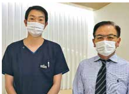
• なないろ歯科クリニック •