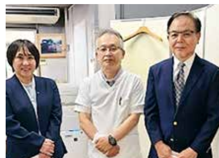
● 河野診療所 ●