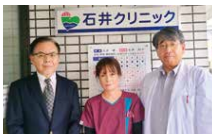
● 医療法人社団 石井クリニック ●