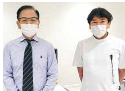
• ひろまち眼科 •