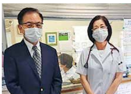
● 堀田医院 ●