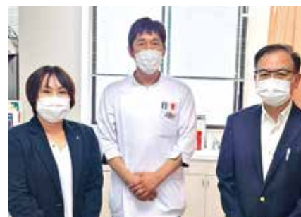
・ 医療法人社団 石泌尿器科医院 ・