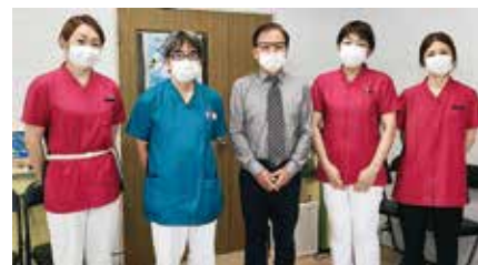
● 杉 医院 ●