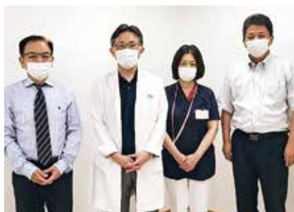
• 医療法人社団薫風会 横山病院 •