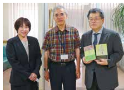
● 藤原脳神経外科クリニック ●