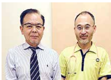
• 医療法人 もりや小児科クリニック •