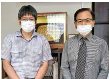
● 青山病院 ●