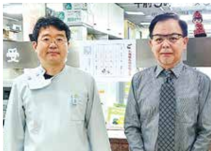
● 医療法人社団有信会 呉記念クリニック ●