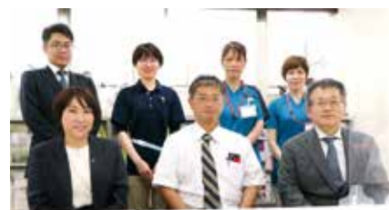
● マッターホルンリハビリテーション病院 ●