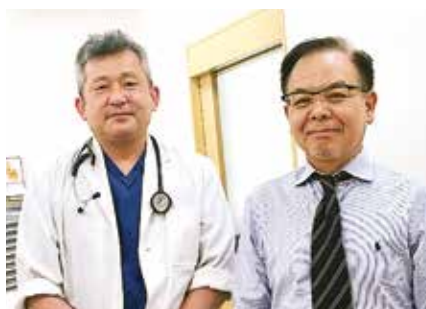
• 医療法人 松尾内科・循環器内科クリニック •