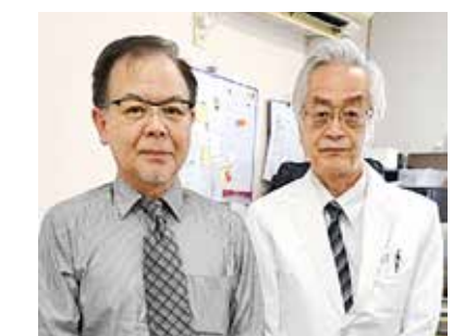
● 医療法人社団森川内科医院 ●