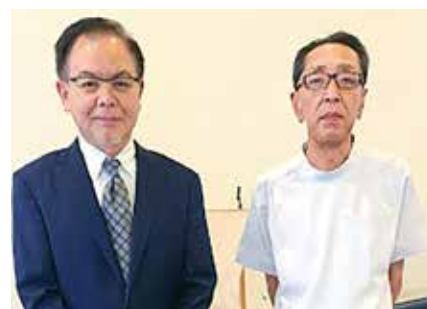
● 城本内科医院 ●