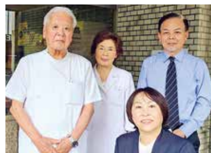
• 医療法人社団 産婦人科小児科松田医院 •