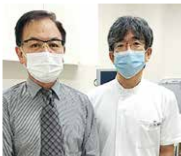
● 西亀会 みつの内科消化器科クリニック ●