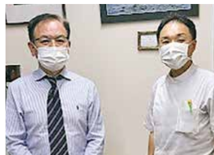
• 上田耳鼻咽喉科医院 •