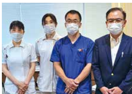
・ いう腎・泌尿器科クリニック ・