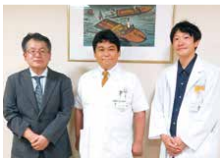
● 医療法人社団中川会 呉中通病院 ●