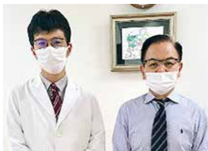
• 小早川クリニック 心療内科 •