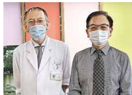
● 早川クリニック ●