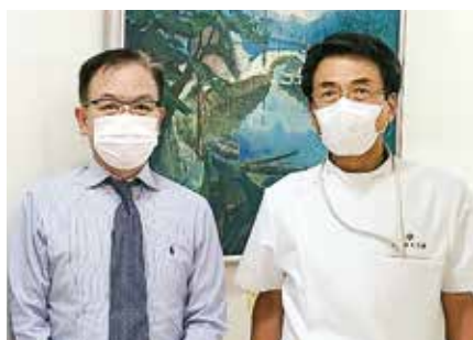
● 医療法人社団 森本医院 ●