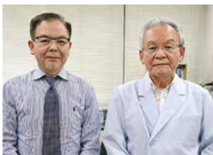
● 医療法人社団 田中医院 (音戸) ●