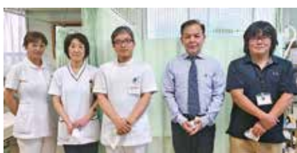
● 大矢整形外科病院 ●