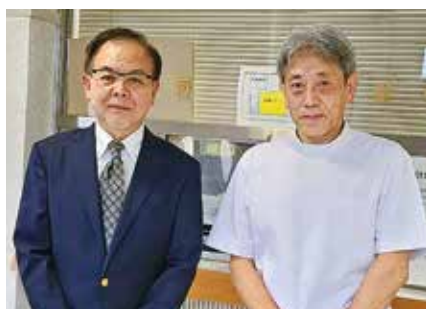
● 高橋医院 ●