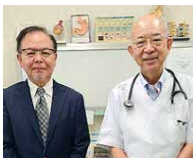
● 宮原通りクリニック ●