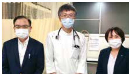
● 大原内科循環器科 ●