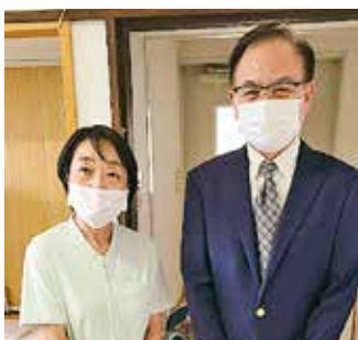
● 岡田医院 ●