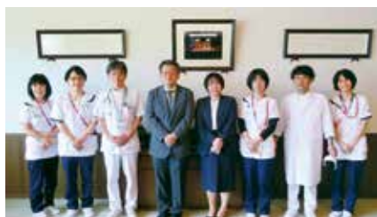
● 済生会広島病院 ●