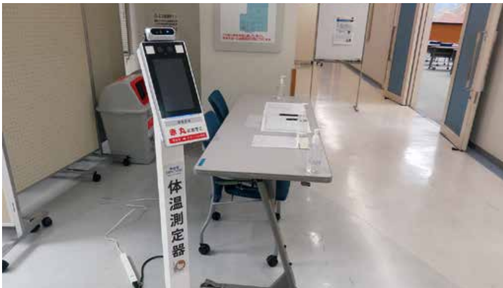
会場入り口に設置した自動体温測定器

今後も感染状況を鑑みながらの開催とはなりますが、計画通り実施する予定ですので、ぜひご参加くださいますようお願い申し上げます。