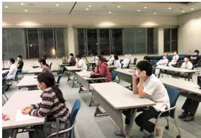
地域の医療機関の先生方にもお越しいただきました