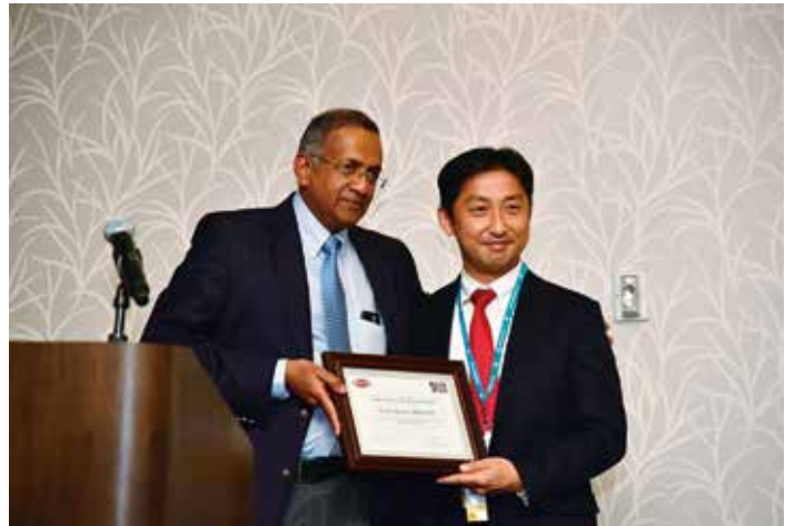
写真1 Raju先生（左）に表彰していただきました

米国・サンディエゴで開催されたDDW2019（米国消化器病関連学会週間）期間中の5月20日、Gastrointestinal Endoscopy誌とVideoGIE誌（米国消化器内視鏡学会誌）のReviewer Award授賞式が執り行われ、2019年度のBest VideoGIE Reviewerとして表彰していただきました。VideoGIEのEditor-in-chiefであるMDアンダーソンがんセンターのRaju先生から記念の盾をいただきましたが、Raju先生は実は以前当院に内視鏡手術見学に来られており、お互い久しぶりの再会を喜ぶことができました（写真1）。