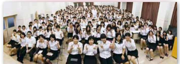
上池前学校長の最終講義