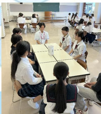
←座談会 在校生にいろいろ聞いてみるコーナーです♪