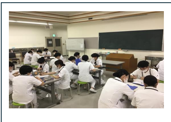
〈助言を受けたのち、計画の修正に取り組みました (写真 下2枚)〉