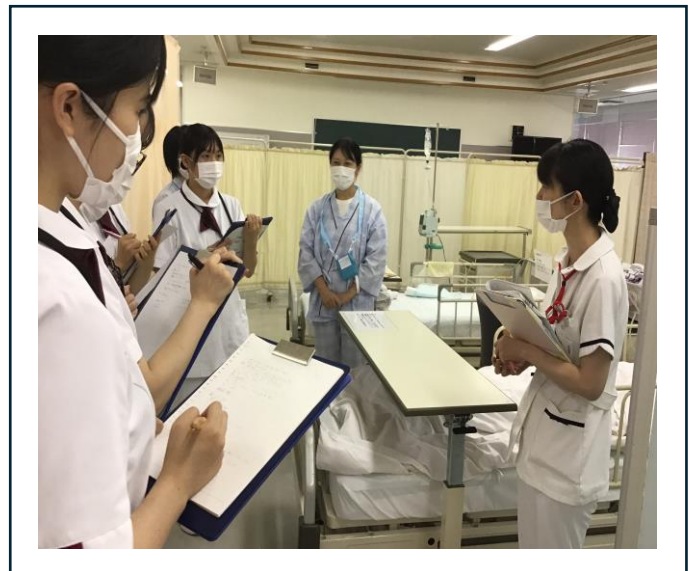
〈援助実施後、場面の振り返り (写真 上2枚)〉