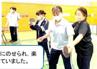
「卓球」澤先生と卓球体験