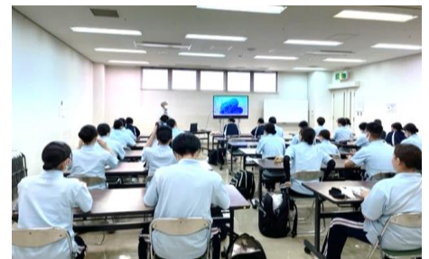
阿賀歴史文化研究会作成のDVD(江戸時代に阿賀地区で流行したコレラの対策について)を視聴