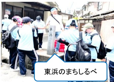
東浜のまちしるべ